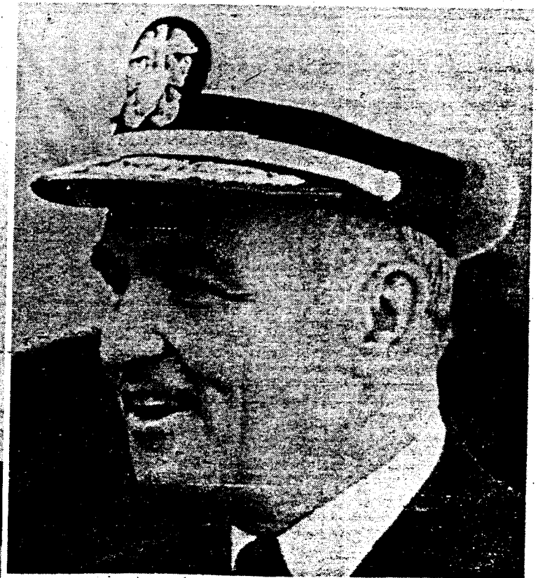
El nuevo director de la CIA, almirante Turner, bajo cuya jurisdicción quedarán todos los servicios de inteligencia de EE.UU. En una de las fotos, el Presidente Carter saluda al almirante que ha sido hasta el momento comandante de las fuerzas de la OTAN en Europa.